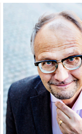
Porträttfoto: Tomas Ohlsson