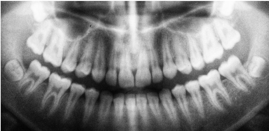
Bland annat röntgen av visdomständer är en vanlig metod vid medicinska åldersbedömningar

Migrationsverket bör också ges i uppdrag att göra en ny prövning av samtliga fall där medicinska åldersbedömningar har använts, och i en sådan bör medicinska åldersbedömningar inte viktas upp i den sammantagna bedömningen. De som befanns ha varit barn vid förra beslutstillfället ska få sina ärenden omprövade och eventuella rättsliga förluster ska läkas. Så kan regeringen leva upp till sina föresatser om ett ordnat och rättssäkert asylmottagande.