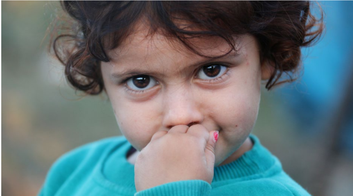
Barn knyter snabbt an till ett nytt samhälle. Deras rätt till ett hem ska respekteras.

därmed människosmuggling och ger också möjlighet att prioritera de personer som är mest utsatta, har svårast att fly på andra vis, och är i störst behov av vidarebosättning och skydd.